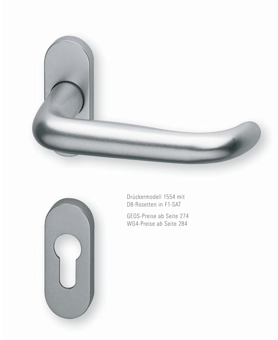
Drückermodell 1554 mit D8-Rosetten in F1-SAT GEOS-Preise ab Seite 274 WG4-Preise ab Seite 284